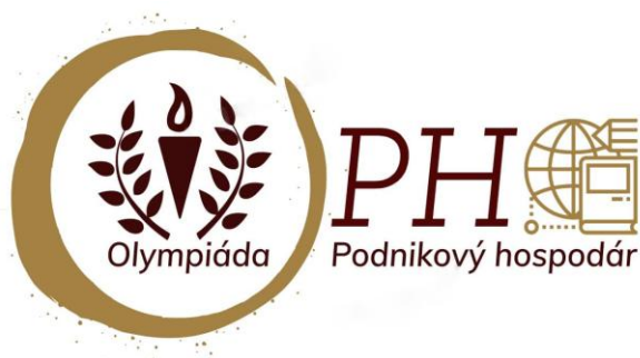
Obrázok 2 Logo súťaže Olympiáda podnikový hospodár