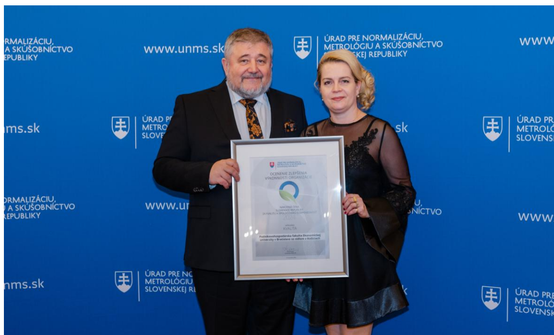
Obrázok 3 Národná cena SR za kvalitu a spoločenskú zodpovednosť 2024

Fakulta dlhodobo a systematicky buduje vlastný systém zabezpečovania kvality, ktorý bol už v roku 2008 uznaný za zlepšenie výkonnosti podľa modelu CAF v súťaži Národná cena SR za kvalitu (kategória C3 – iné organizácie verejného sektora) a v roku 2010 sa stala finalistom tej istej súťaže podľa modelu CAF (kategória C3 – iné organizácie verejného sektora). V roku 2024 sa PHF EU zapojila do súťaže Národná cena Slovenskej republiky za kvalitu a spoločenskú zodpovednosť v kategórii Kvalita, podkategória C3 – organizácie verejného sektora, kde bola uznaná za zlepšenie výkonnosti organizácie. Ocenenie patrí medzi najprestížnejšie uznania kvality na Slovensku a potvrdzuje vysokú úroveň riadenia, kvalitu vzdelávacieho procesu a celkovú výkonnosť fakulty. Slávnostné vyhlásenie výsledkov sa uskutočnilo 14. novembra 2024 v Historickej budove Národnej rady SR v Bratislave.