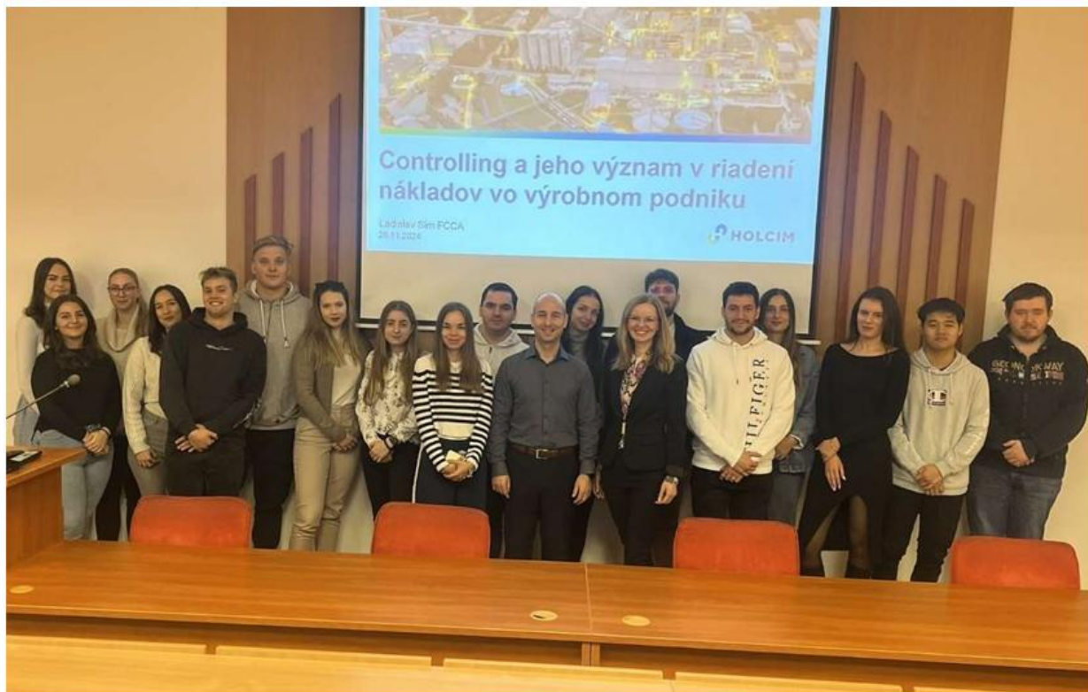
Obrázok 1 Foto z prednášky „Controlling a jeho význam v riadení nákladov vo výrobnom podniku“

Prehľad všetkých realizovaných pozvaných odborných prednášok v spolupráci s hospodárskou praxou na PHF EU poukazuje Tabuľka 26.