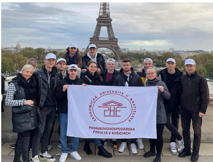
Obrázok 6 Študenti PHF EU na World InterUniversities Championships 2023