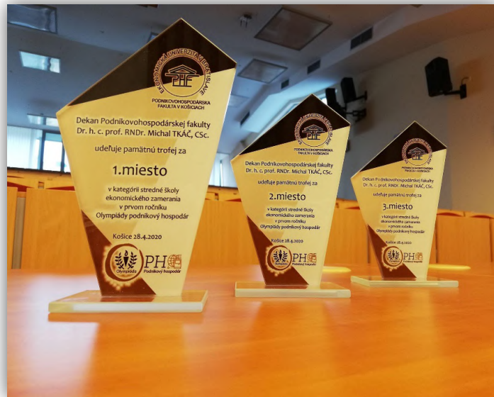
Obrázok 14 Ceny pre víťazov Olympiády podnikový hospodár

Celoslovenské kolo, ktorého sa zúčastnilo 114 najlepších súťažiacich, prebiehalo prostredníctvom online testu v prostredí Moodle 27. apríla 2023. Pri príprave online testov sme opäť vychádzali z obsahovej náplne vyučovacieho procesu na jednotlivých stredných školách, ktoré reprezentujú tri kategórie. Na základe výsledkov dosiahnutých v celoslovenskom kole uvádzame výsledky jednotlivých skupín súťažiach.