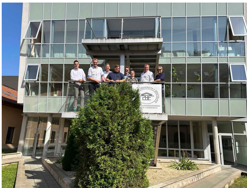
Obrázok 10 Stretnutie projektu EXPERTISE

V dňoch 13. a 14. septembra 2023 Podnikovohospodárska fakulta Ekonomickej univerzity v Bratislave v Košiciach sprostredkovala významné stretnutie projektu EXPERTISE. Na tejto spolupráci sa podieľali zástupcovia renomovaných inštitúcií z Technische Universität Dortmund, University of Twente, Ekonomickej univerzity v Bratislave a Lappeenranta-Lahti University of Technology LUT.