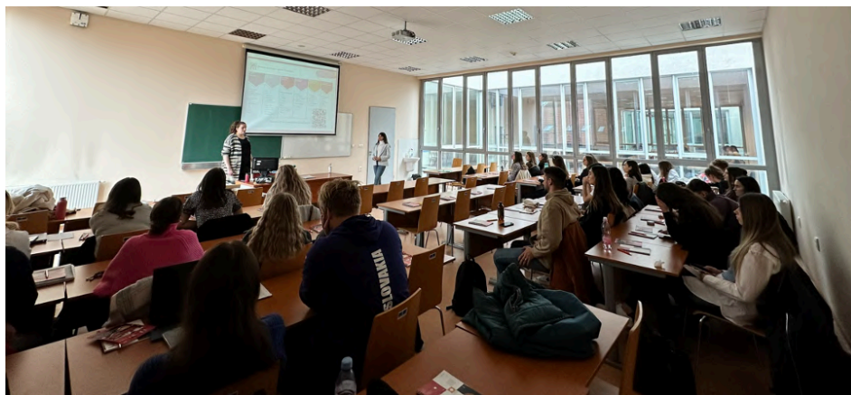
Obrázok 9 Odborná prednáška zo spoločnosti PWC

V priebehu stretnutia mali študenti príležitosť pracovať v tíme, analyzovať špecifické prípady a navrhovať efektívne stratégie vo vybranom podniku. Predstavitelia spoločnosti PWC následne zdieľali svoje odborné skúsenosti z praxe. Táto interakcia umožnila našim študentom lepšie pochopiť náročné aspekty procesu úloh pri výbere zamestnancov a získali tak užitočné rady pre svoju budúcu kariéru. Táto skvelá iniciatíva prispeje k rozvoju našich študentov a pomôže im pri prechode z akademickej sféry do profesionálneho prostredia.