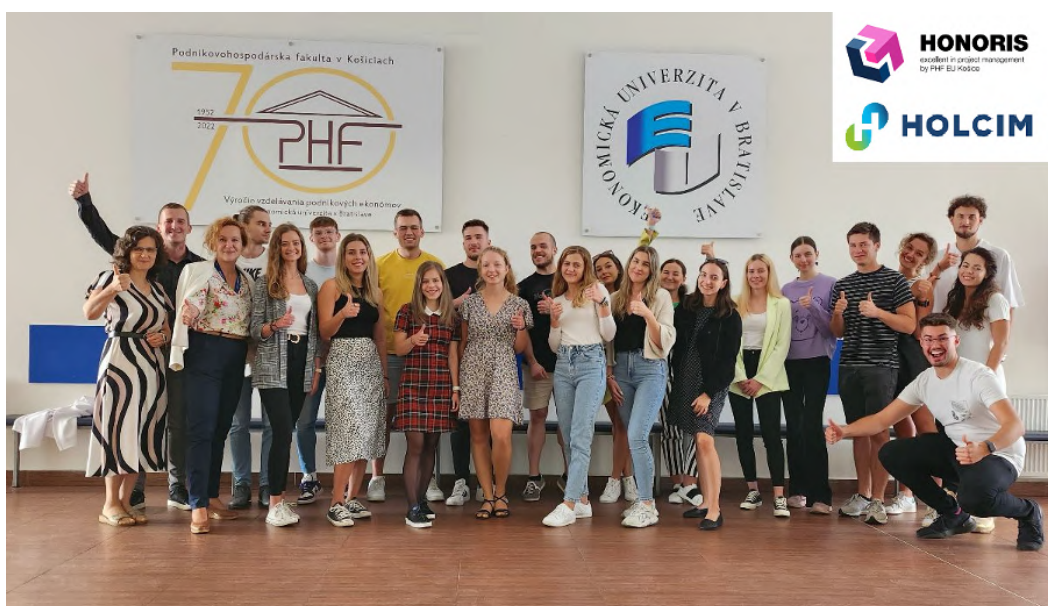
Obrázok 8 Študenti programu HONORIS

Absolvovaním tohto výberového predmetu dochádza u študentov k výraznejšiemu získavaniu praktických znalostí v oblasti projektového manažmentu na základe riešenia konkrétnych praktických úloh z projektového manažmentu, resp. riešením reálnych úloh v tímoch priamo v spoločnosti Deutsche Telekom IT Solutions Slovakia, s. r. o. Študentom je v tejto spoločnosti zároveň poskytnutý priestor pre možnosť part-time zamestnania.