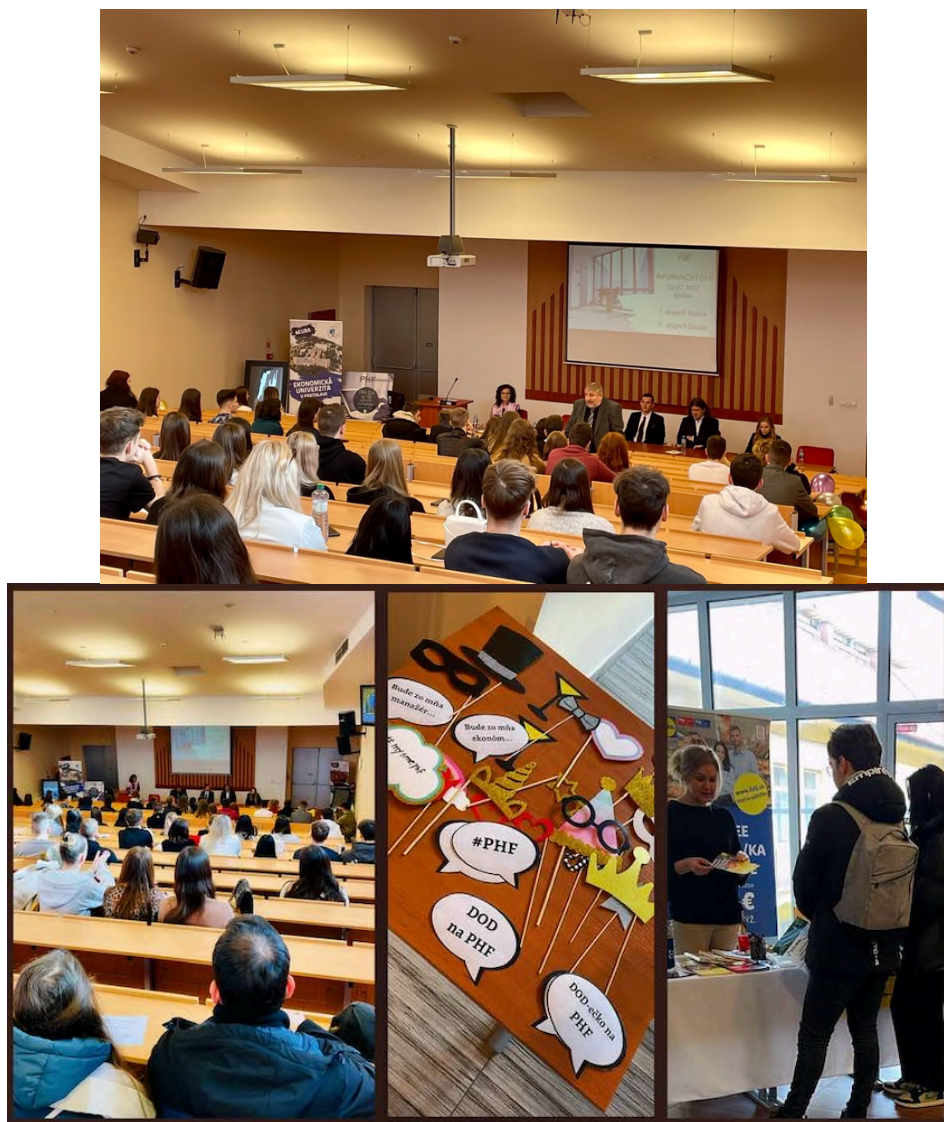
Obrázok 18 Informačný deň PHF EU pre uchádzačov v Košiciach