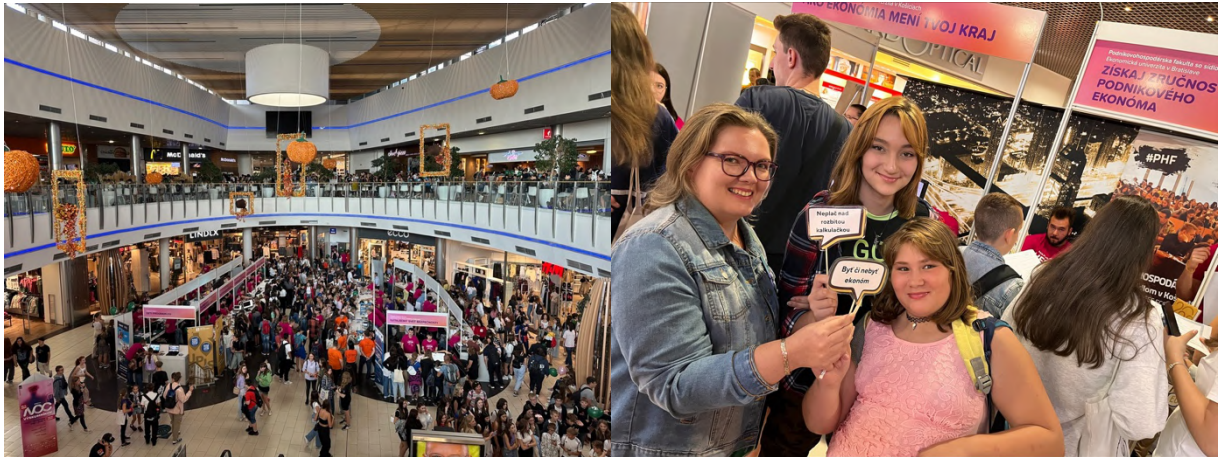
Obrázok 15 PHF EU na Noci Výskumníkov v KE

V dňoch 18.10.2022 v Košiciach, 19.10.2022 v Prešove a 26.10.2022 v Poprade boli zástupcovia PHF EU účastní na podujatí Kam na vysokú .