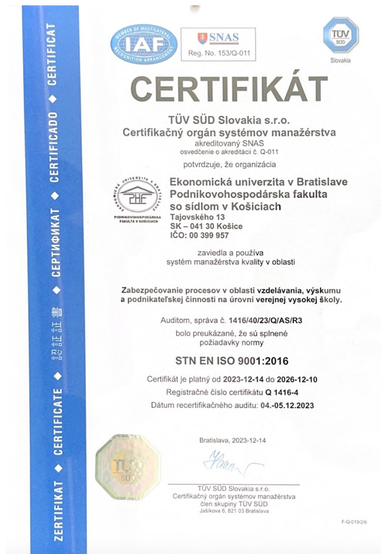
Obrázok 19 Certifikát TÜV SÜD Slovakia s.r.o

Na základe recertifikačného auditu, ktorý sa konal v dňoch 04. – 05.12.2023 získala PHF EU certifikát TÜV SÜD Slovakia s.r.o. Certifikačný orgán systémov manažérstva akreditovaný SNAS osvedčenie o akreditácii č. Q-011, kde PHF EU zaviedla a používa systém manažérstva kvality podľa STN EN ISO 9001:2016 v Zabezpečovaní procesov v oblasti vzdelávanie, výskumu a podnikateľskej činnosti na úrovni verejnej školy.