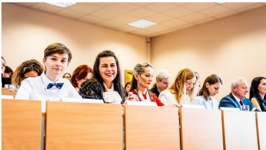
Obrázok 12 Účastníci medzinárodnej vedeckej konferencie MTS

Katedra kvantitatívnych metód tiež každoročne organizuje dve vedecké konferencie na štvrťročnej báze s názvom Trends in Application of Statistical Methods for Quality Improvement a Zlepšovanie procesov pomocou štatistických metód.