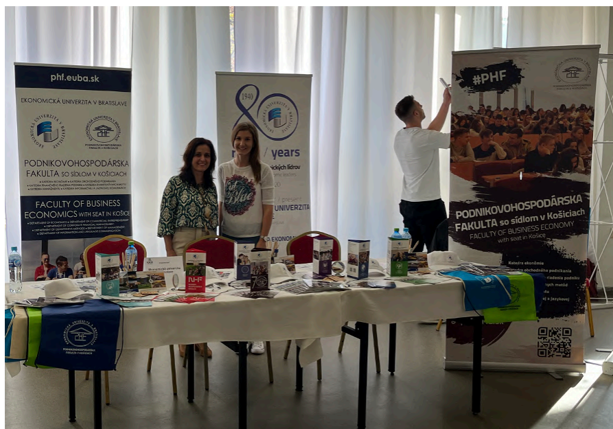
Obrázok 16 Kam na vysokú Poprad

V dňoch 18.10.2022 v Košiciach, 19.10.2022 v Prešove a 26.10.2022 v Poprade boli zástupcovia PHF EU účastní na podujatí Kam na vysokú .