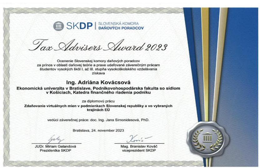
Obrázok 3 Ocenenie v odbornej súťaži TAX ADVISERS AWARD v roku 2023