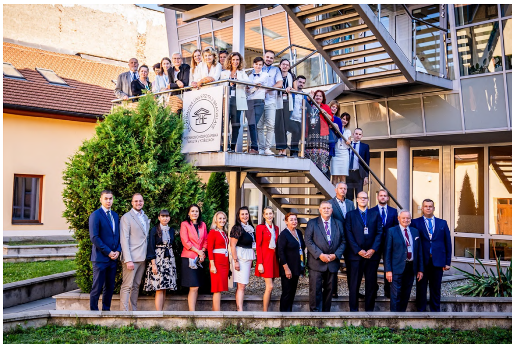
Obrázok 11 Medzinárodná konferencia MTS

V roku 2023 sa na PHF EU v Košiciach a pod jej záštitou realizovalo viacero vedeckých podujatí. Najvýznamnejším podujatím, ktoré fakulta zorganizovala, bola medzinárodná vedecká konferencia MTS Marketing manažment, obchod, finančné a sociálne aspekty podnikania (Marketing, Management, Trade, Financial and Social Aspects of Business), ktorej sa aktívne zúčastnili viacerí výskumníci zo zahraničia.