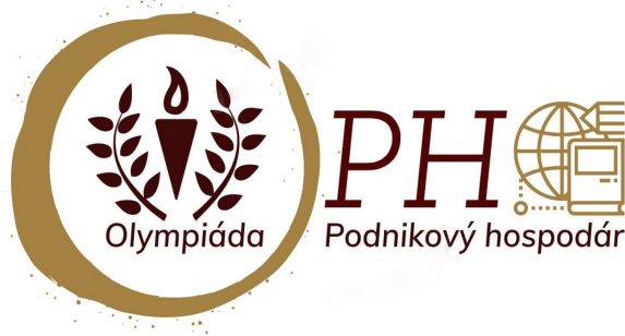
Obrázok 13 Logo súťaže Olympiáda podnikový hospodár

Predmetom súťaže je testovanie znalostí študentov v rámci celého územia Slovenskej republiky z oblasti ekonómie, podnikovej ekonomiky, Európskej únie, náuky o spoločnosti, finančnej gramotnosti.