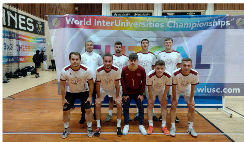
Obrázok 5 Futbalový tím PHF EU na World InterUniversities Championships 2023

Ekonomická univerzita v Bratislave sa zúčastnila 8. ročníka World InterUniversities Championships 2023 v Paríži a prvýkrát univerzitu reprezentovali aj študenti PHF EU, ktorí boli v Paríži v dňoch 31.10. – 5.11.2023. Na WIUC 2023 malo svoje zastúpenie 76 univerzít z 28 štátov a stretlo sa tam cca 3 000 športovcov.